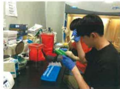
(말라리아바이러스 PCR 전처리 과정)